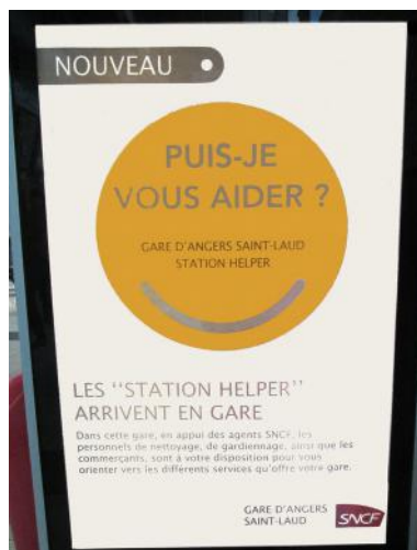
Panelo en la stacidomo de Angers

Ĉu la franca lingvo estas tiom netaŭga, malriĉa, ke ne eblas trovi esprimon aŭ francan nomon ? Aŭ ĉu nun tro eksmodas uzi la francan ? Kio pri la tiel nomata " leĝo Toubon ", kiu celis protekti la francan lingvon ? Almenaŭ unu certa afero : ne plu uzi lingvon estas unua paŝo al ĝia flankenpuŝo kaj, iam, mortestonto.