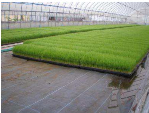
Foto: rizplantidoj vartitaj en vinila forcejo

Fakte rizo de Fukuŝima bone vendiĝas por rapidservaj restoracioj, hospitaloj ktp, sen la nomo de Fukuŝima. Rizo de Fukuŝima estas tre bongusta, do ĝi taŭgas por tiuj restoracioj, ĉar oni povas aĉeti malmultekoste tiun bongustan rizon