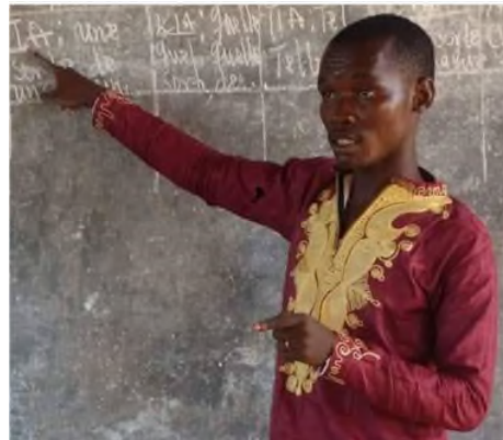
Dankon Kwibe en fotoj senditaj de Mirejo Grosjean, el 2018

Temas pri interesa, pensiga filmo kun subtekstoj en la angla lingvo realigita en afrika etoso. Malgraŭ malbona prononcmalmaniero de kelkaj aktoroj, ŝokaj paroloj kaj agoj ĉe la filmfino – kio donas impreson pri manko de respekto al virino – la kinaĵo estas vere spektinda ankoraŭ, ke la rezulto teknike estas admire bonkvalita kaj la rolluloj tre elturniĝemaj kun limigitaj rimedoj.