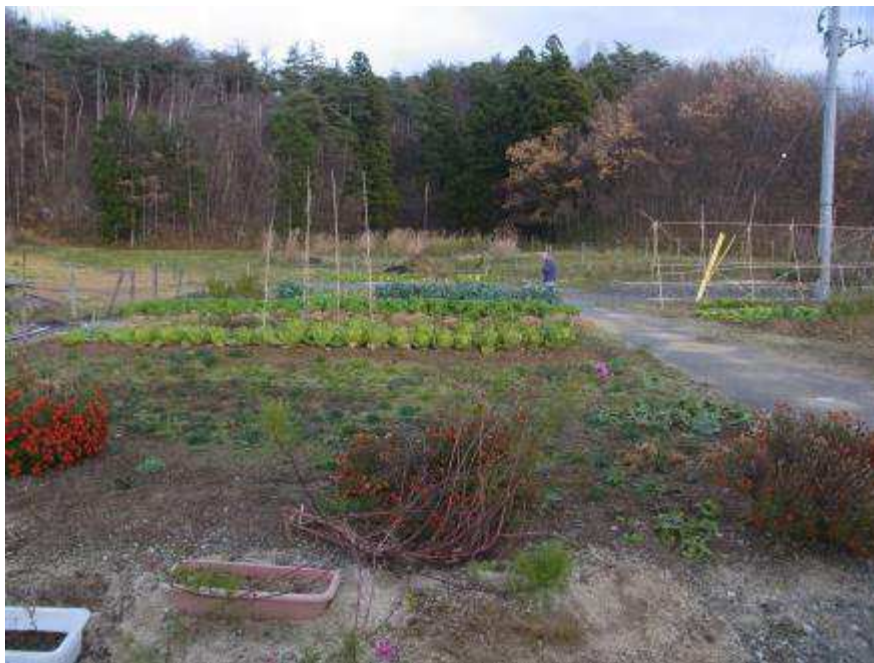
La kampo estas purigita, sed trans la kampo estas poluite.

Li plu kondukis min al alia loko ekster la barilo, kie la loĝantoj povas libere promeni. Mi mezuris radioaktivecon tie, kaj la cifero tuj atingis 0,80. Li kolere diris al mi: “Ni rifuĝis de mia urbo Namie al tiu ĉi loko, ĉar tie estas radioaktive poluite. Kial ni devas denove loĝi en tiu ĉi poluita loko? En la urbo Namie nun troviĝas distriktoj malpli poluitaj ol ĉi tie”. Li jam petis de la urbo Motomija, ke oni purigu la ĉirkaŭaĵojn de la provizora domaro, sed la urbo respondis, ke la tereno apartenas al la ŝtato, do la urbo ne povas fari ion pri ĝi. Li plu petis de la urbo, ke ĝi transsendu lian peton al la ŝtato, sed la respondo ne venis.