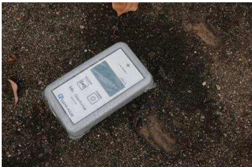
Dozmetro, kiu montras 2,20 mikrosivertojn

ciferojn, mi estis ŝokita kaj el miaj okuloj falis larmoj. Mi dormigis miajn gefilojn en tiel poluita loko ! Mi kritikis min kaj larmis. Ekstere la cifero estis pli granda : en la ĝardeno la cifero estis 3,3 mikrosivertoj kaj en la fluilo la cifero estis 23 mikrosivertoj ! Vidante tiujn ciferojn, mi konvinkiĝis, ke ni ne plu povas loĝi en tiu ĉi domo, kaj decidis translokiĝi al alia gubernio.