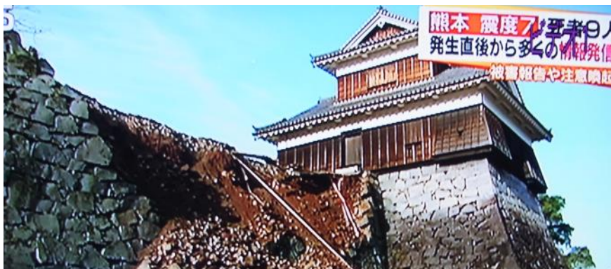
Kastelo Kumamoto, kies tegoloj falis kaj muroj difektiĝis.

La 14an de aprilo okazis granda tertremo en la gubernio Kumamoto en la suda insulo Kjuuŝuu. Ĝia forteco estis magnitudo 6,8 kaj la grado de la tremo estis 7. Du tagojn poste, la 16an de aprilo, norde de la epicentro de la unua tertremo okazis alia granda tertremo kun magnitudo 7,3 kaj ĝia grado estis ankaŭ 7. Neniam antaŭe en Japanio okazis sinsekve du fortegaj tertremoj en unu regiono. Krom tio, ne nur en Kumamoto, sed ankaŭ en Ooita situanta oriente okazas tertremoj. Hodiaŭ estas la 29a de aprilo, do jam pasis du semajnoj, sed tremoj ne ĉesas.