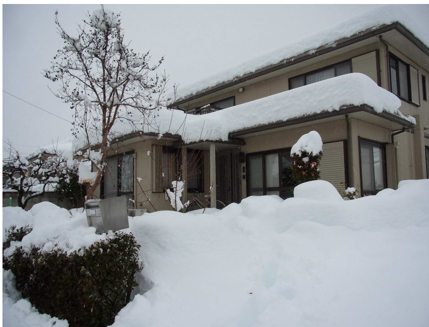
Ma maison au matin du 15 février

Tokyo et les préfectures environnantes ont souffert d'une énorme quantité de neige